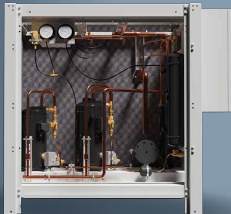
ЦХМ на базе спиральных компрессоров